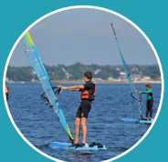
Planche à voile (10 ans-adulte)

Stage sur 5 demi-journées, du lundi au vendredi